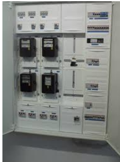
2. Zählerschrank (Tür geöffnet)