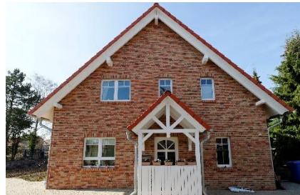
2. Dach – Seitenansicht