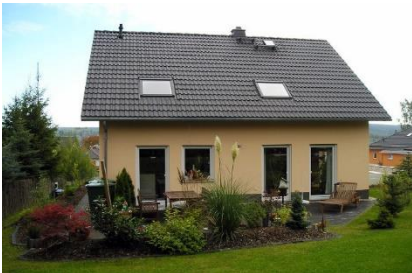
1. Dach – Frontansicht

Die folgenden Fotos benötigen wir von Ihnen: