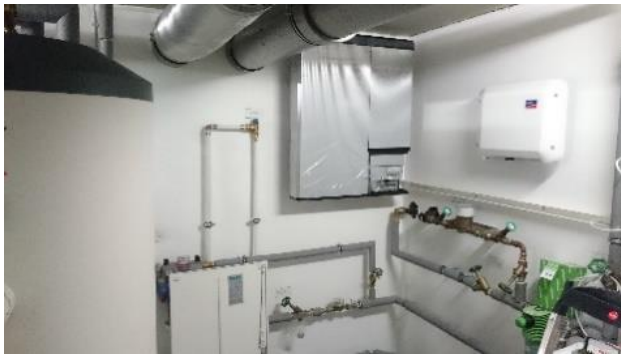
1. Platz für Stromspeicher