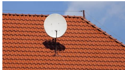
4. Dach – Objekte auf dem Dach